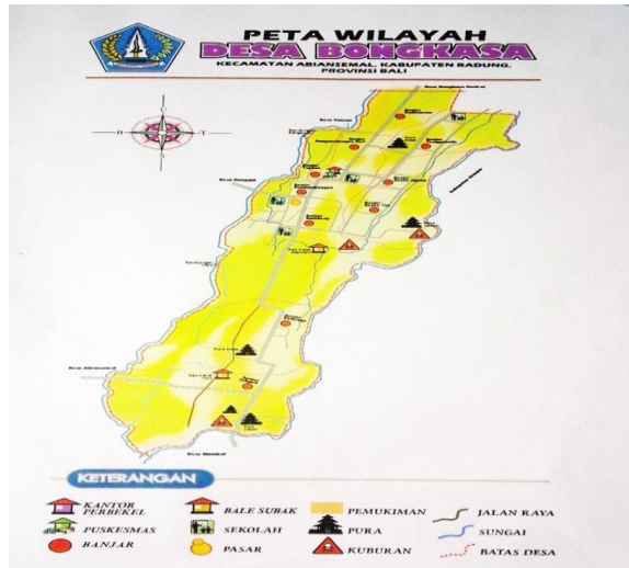
Gambar 4.1: Peta Wilayah Admsinitratif Desa Bongkasa