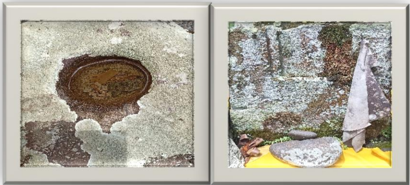
Gambar 5.3 Lumpang dan Patok di Pura Puseh Desa